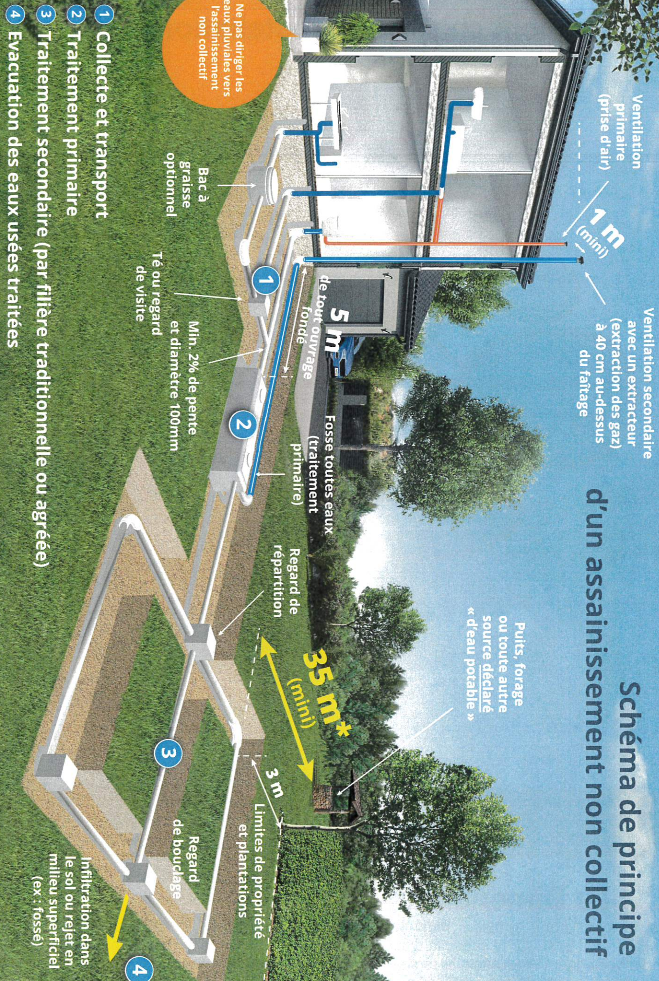
Schéma de principe d'un assainissement non collectif

Les différentes collectivités gestionnaires de SPANC se sont engagées dans cette Charte afin d'assurer une meilleure lisibilité pour l'utilisateur et une cohérence entre les territoires du département.